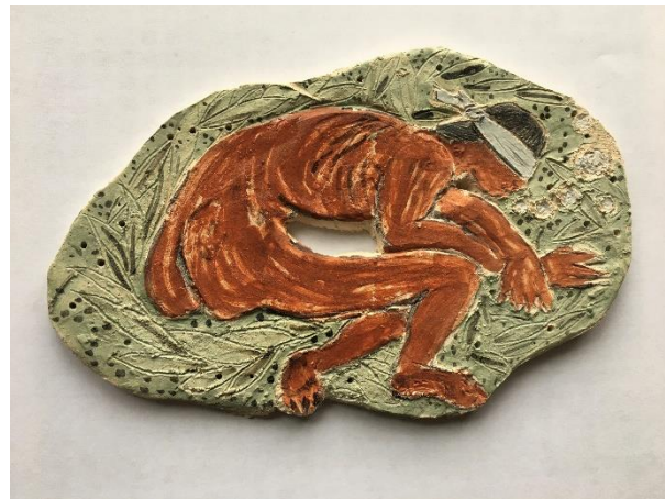
afb.: de Beproeving