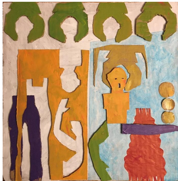
.afb. Dancing in the House, 30 x 30 cm, kartoncollage

Op 14 januari konden gegadigden hun werk inleveren waar het vanaf diezelfde week al te zien en te koop is!