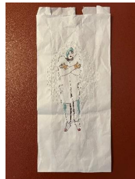
Afb: 'Groningen' borduurwerk voor Verlangen naar Elders (project voor de HKK 2026)

Mocht je geen prijs meer stellen op deze Nieuwsbrief dan graag een berichtje naar onderstaand e-mail adres.