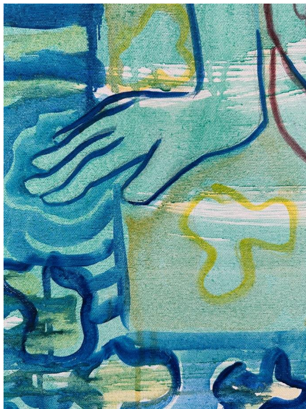
Afb. Lumba Lumba (Bruinvisvrouw) olieverfschilderij detail van mijn inzending

Ook dit jaar is weer een boekje verkrijgbaar!