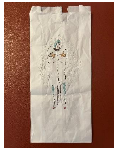
Afb: 'Groningen' borduurwerk voor Verlangen naar Elders (project voor de HKK 2026)

Mocht je geen prijs meer stellen op deze Nieuwsbrief dan graag een berichtje naar onderstaand e-mail adres.