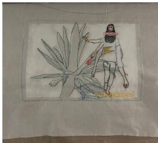
Afb. Ontdekken, borduurwerk op textiel