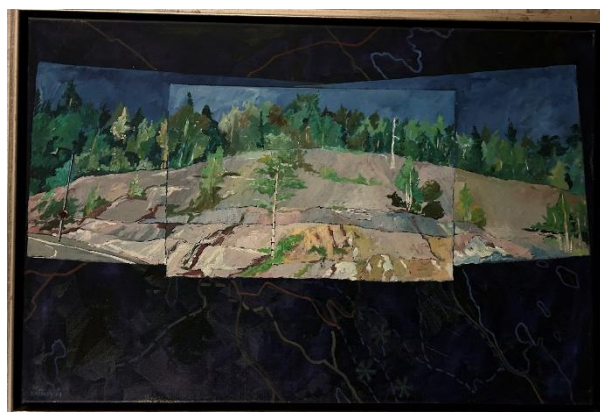
Afb. De Wachters, olieverf/doek