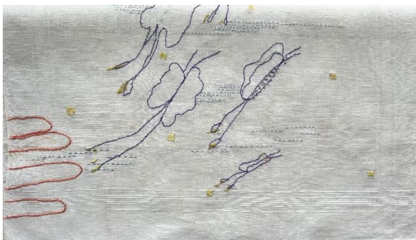
Afb. Femme Exotique (detail), borduurwerk op zakdoeken

N.B.: Ook dit jaar is weer een boekje verkrijgbaar!